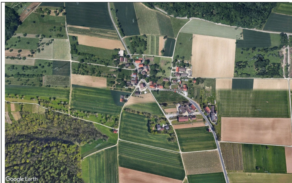
Husarenhof - Stadt Besigheim

Der Weiler Husarenhof besteht aus einer Ansammlung von Wohngebäuden, eines Gewerbebetriebes, einer Gaststätte und weiteren landwirtschaftlich geprägten Bauten. Über die Jahrzehnte hat sich ein Zusammenhang als Ortsteil entwickelt, der nicht mehr wie bisher als Weiler im Außenbereich, als eine Baufeld ehemaliger Aussiedlerhöfe betrachtet werden kann (s. Urteil des VG Stuttgart vom 02.12.2020).