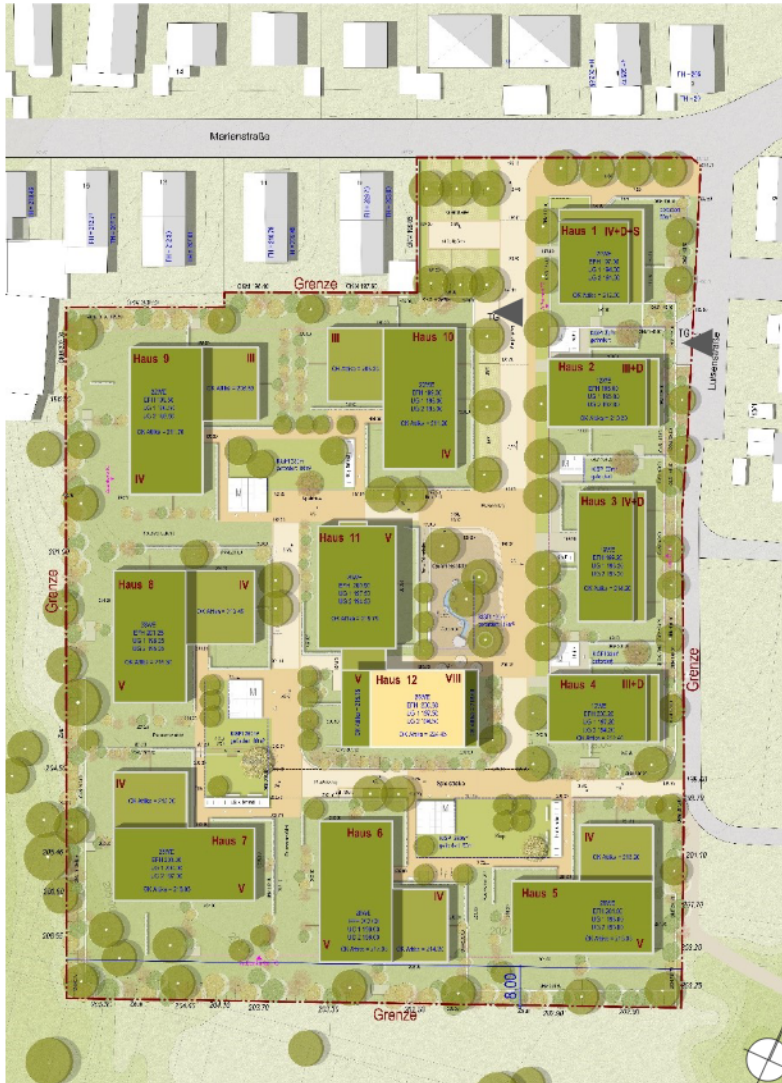
Lageplan mit Dachaufsicht