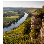
8 Felsengarten- kellerei und Felsengärten