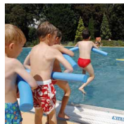
9 Besigheimer Mineral-Park- Freibad