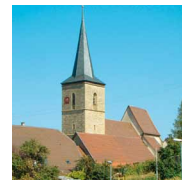
10 Hippolytkirche im Stadtteil Ottmarsheim