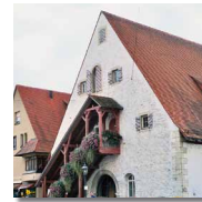
2 Stadhalle »Alte Kelter«