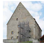
6 Steinhaus am Schochenturm