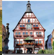
1 Historisches Rathaus und Marktplatz