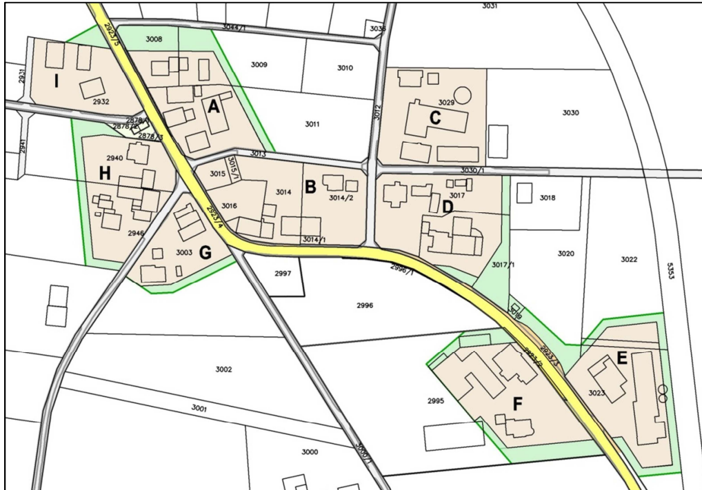
Gebäudegruppen und ihre Abgrenzung

Der Verlauf der Abgrenzung zwischen Innen- und Außenbereich wird - beginnend an der nördlichen Ortsdurchfahrt dem Uhrzeigersinn folgend - bestimmt: