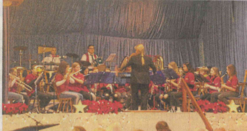
Die Nachwuchsmusiker des Musikvereins bei ihrem Auftritt.

Weiter ging es mit dem aktiven Orchester. Auch der Titel ihres Eröffnungsmarschs „Jubelklänge“ spiegelte das vorherrschende Gefühl des Abends wider. Dann hatte